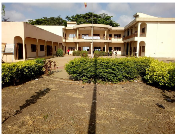
Hôtel de ville de la Commune de Glazoué