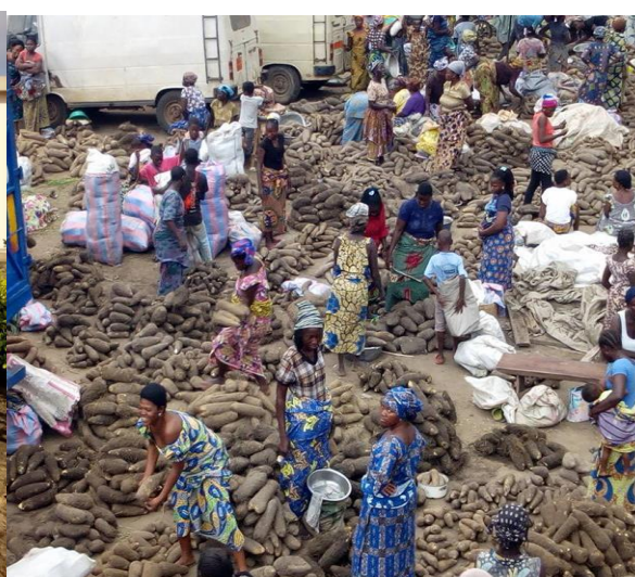
Marché international de Glazoué, site de vente d'igname